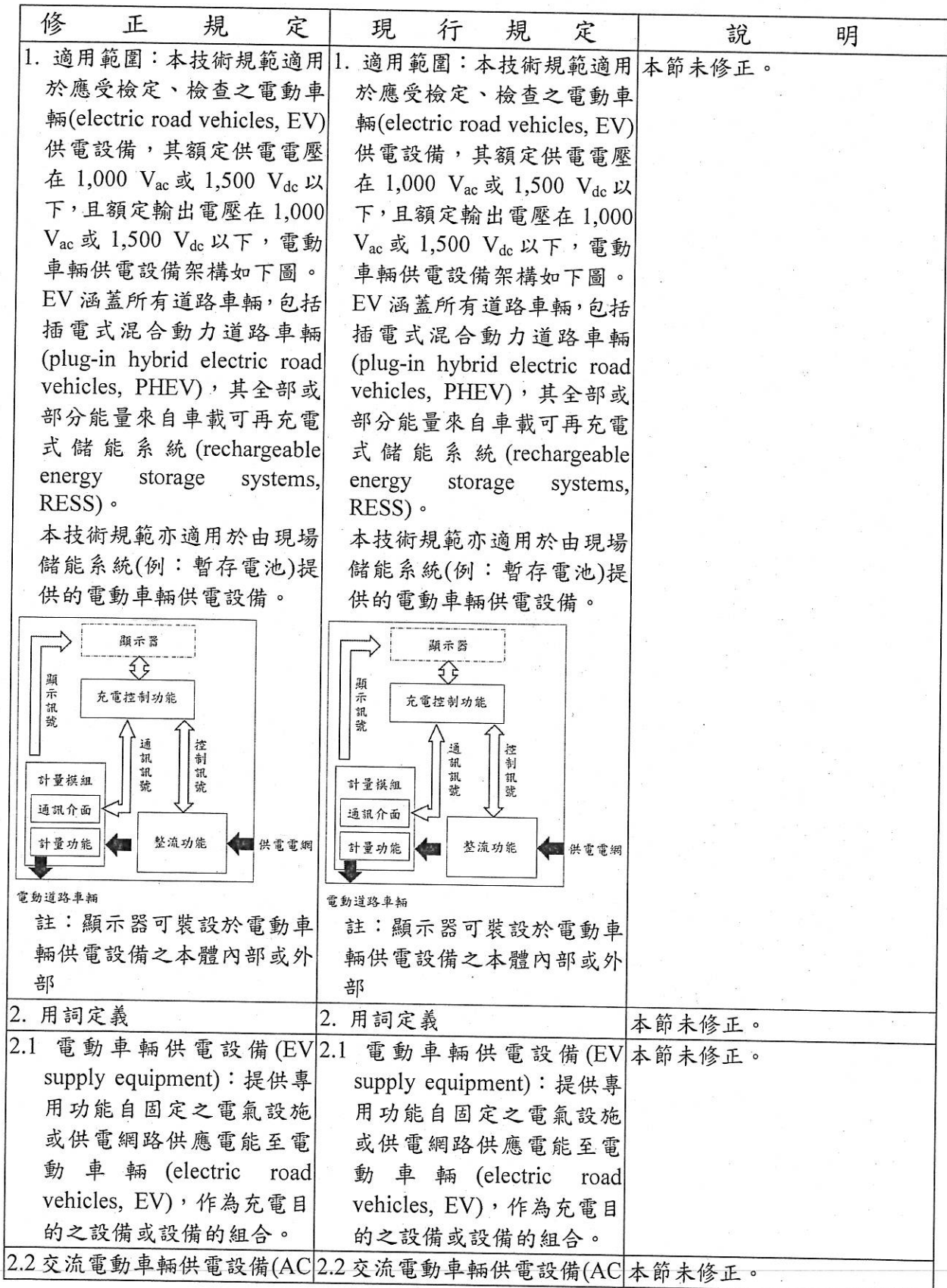
電動車輛供電設備檢定檢查技術規範修正草案對照表