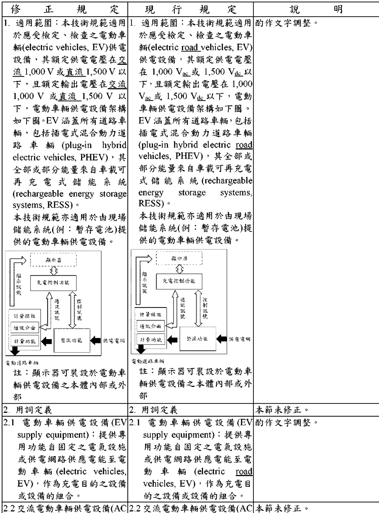
電動車輛供電設備檢定檢查技術規範修正草案對照表